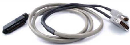
Cable Amphenol en "Y" opcional.